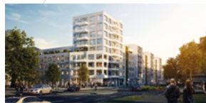
NRW/Düsseldorf Pempelfort Oberbilk